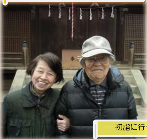
初詣に行ってきました！！