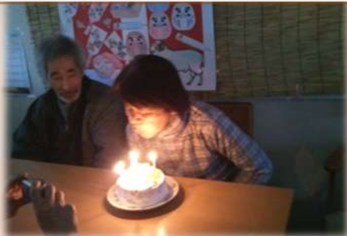
最後はお誕生日会です 1月はお二人が誕生日を迎えられました 皆で作った手作りケーキも美味でした！！