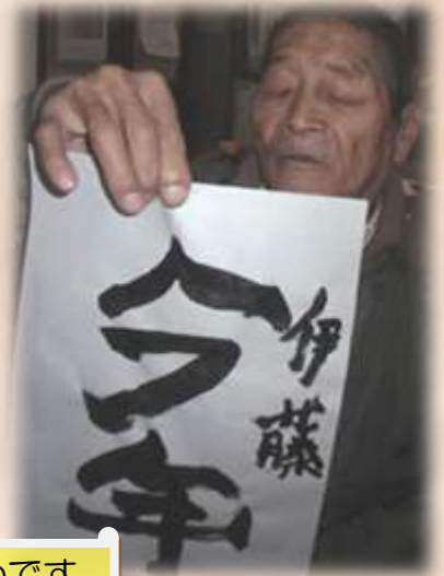
皆さま 何十年ぶり？の書初めです