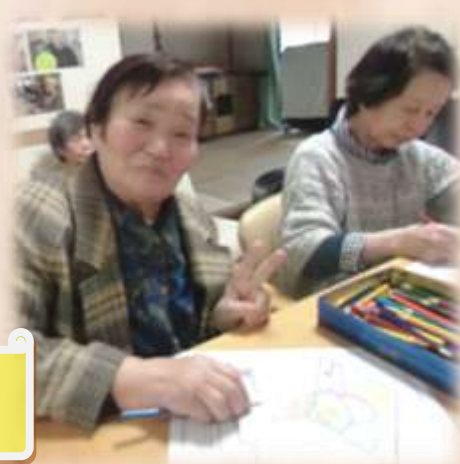
壁に飾る干支のぬり絵 予想以上にキレイに出来ました！