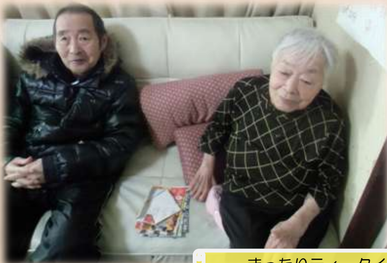
ゆったりティータイム (糖分は控えめで。。)