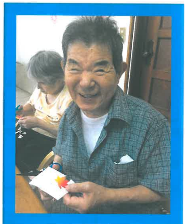
いつも元気いっぱいY様