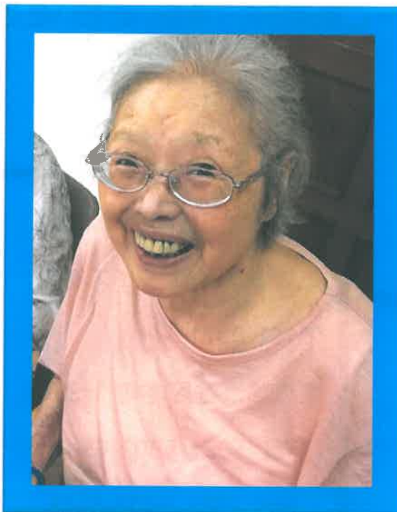
ニッコリ笑顔のステキなK様