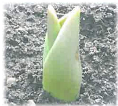
事業所内の庭にも春が感じられます。

個人情報（写真）はご本人及びご家族の同意を頂いた上で掲載させていただいております。