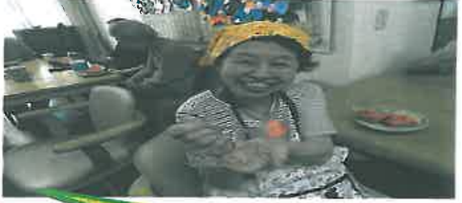
はい あなたも食べる？！