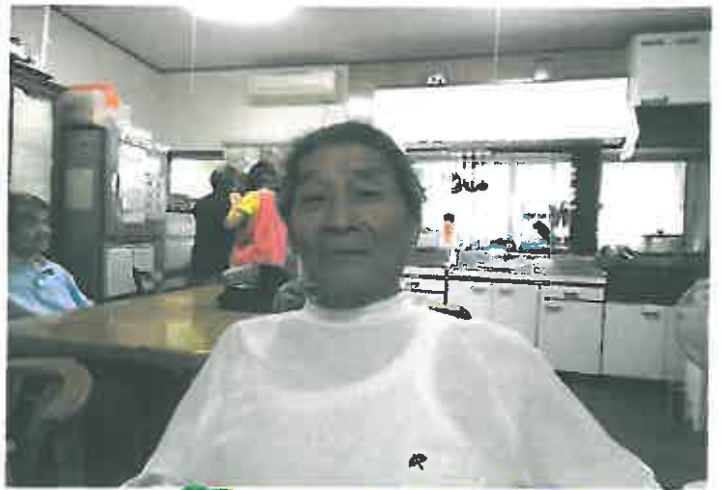
私たち秋津事業所の アイドルです～