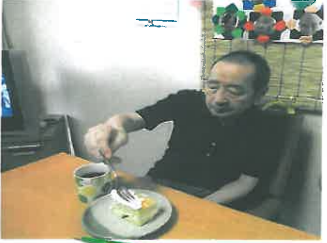
こんなに食べられないよ～