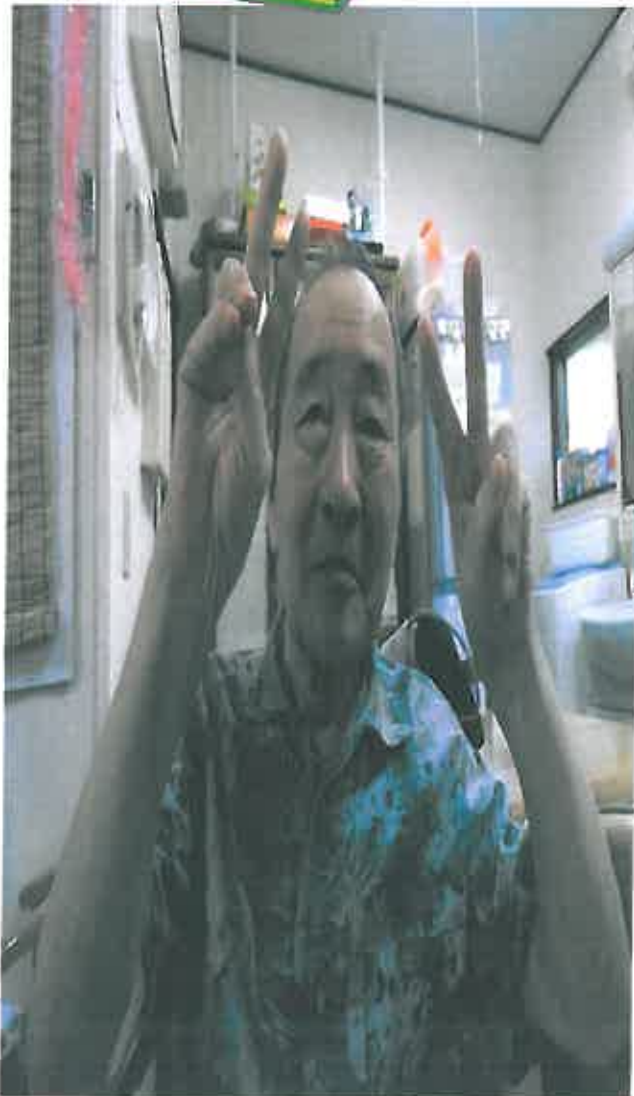
なんだか良くわからないけど、ピースW