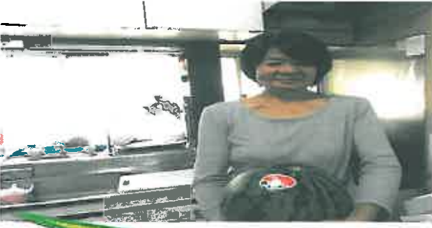
デザートは西瓜だよ～