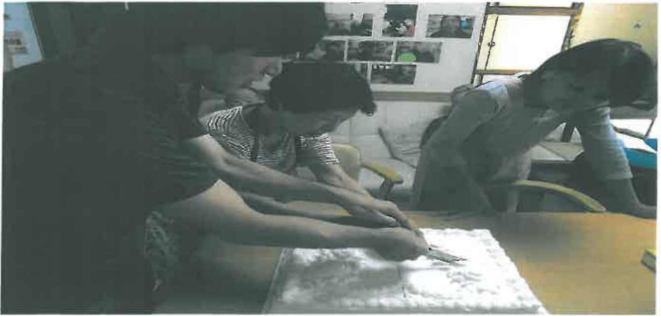
ケーキ大好き！！私の分は大きめに切ってね！ ダメ駄目 皆様均等に切るよ。