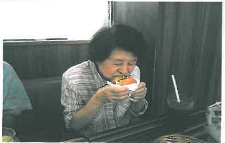
校則違反の買い食い証拠写真