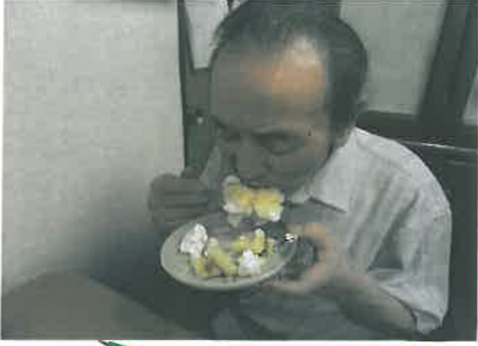
これが、男の食べ方じゃ