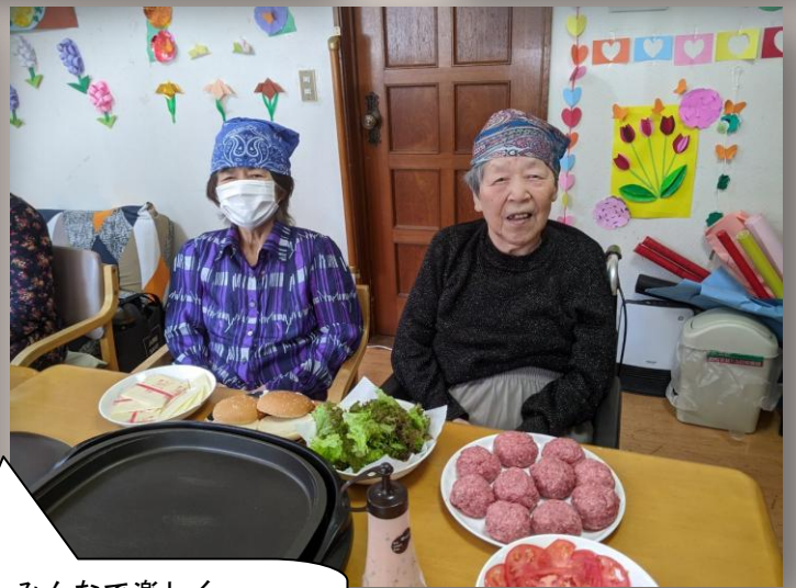
みんなで楽しくチーズバーガー作り！！