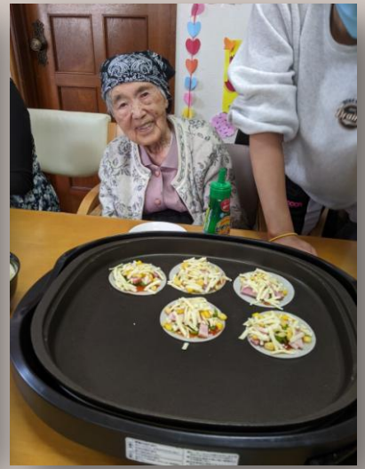
今月は初台事業所恒例の餃子の皮ピザを作成しました！！