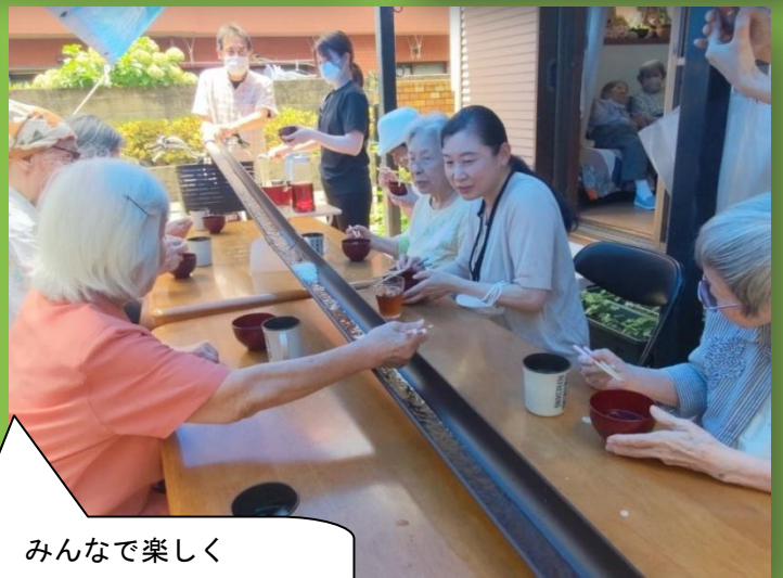
みんなで楽しく 流しソーメンです！！