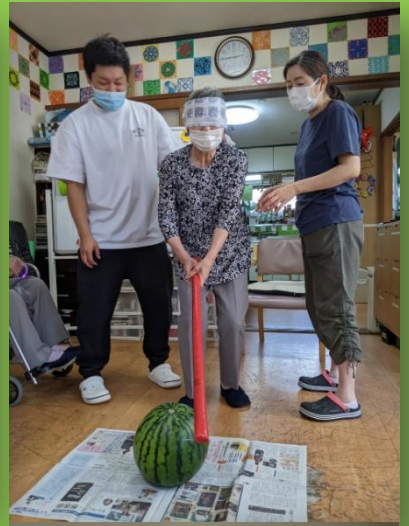
縁日とスイカ割り大会を開催しました！！♡