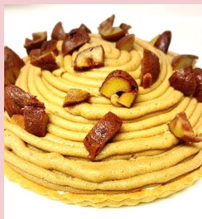
手作りモンブランケーキ