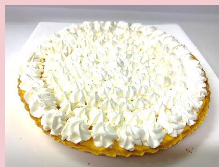
パンプキンプリンタルト