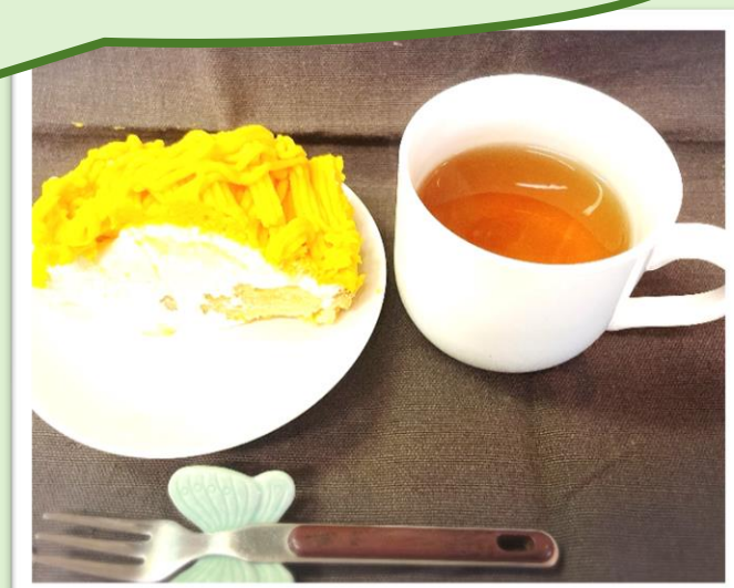
手作りパンフキンタルト