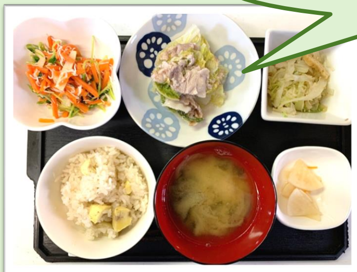
秋の味覚 栗おこわ定食