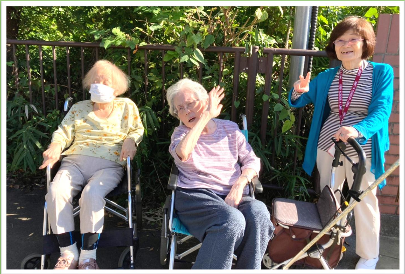
町内会の集まりや、親しい友達と一緒にいる感覚をめざします