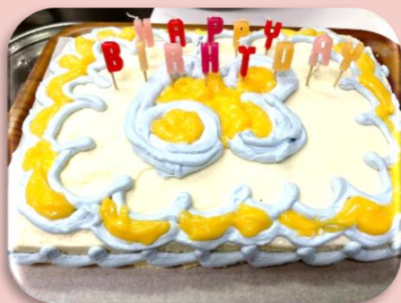
手作りお誕生日ケーキ