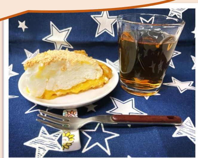
手作りレモンメレンゲタルト