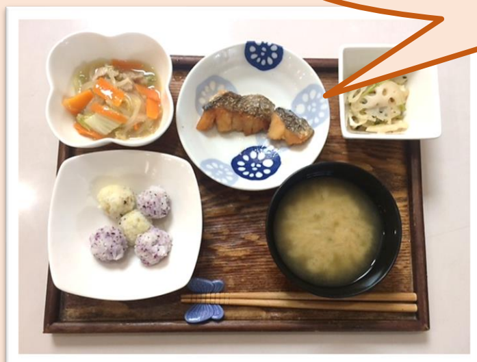
食が進まない方の為の ちっちなおにぎり定食