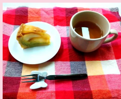
スイートアップルパイ