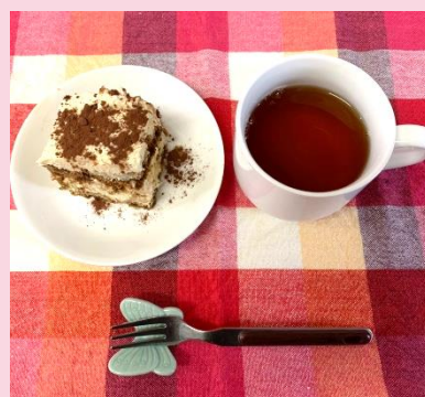
手作りティラミス