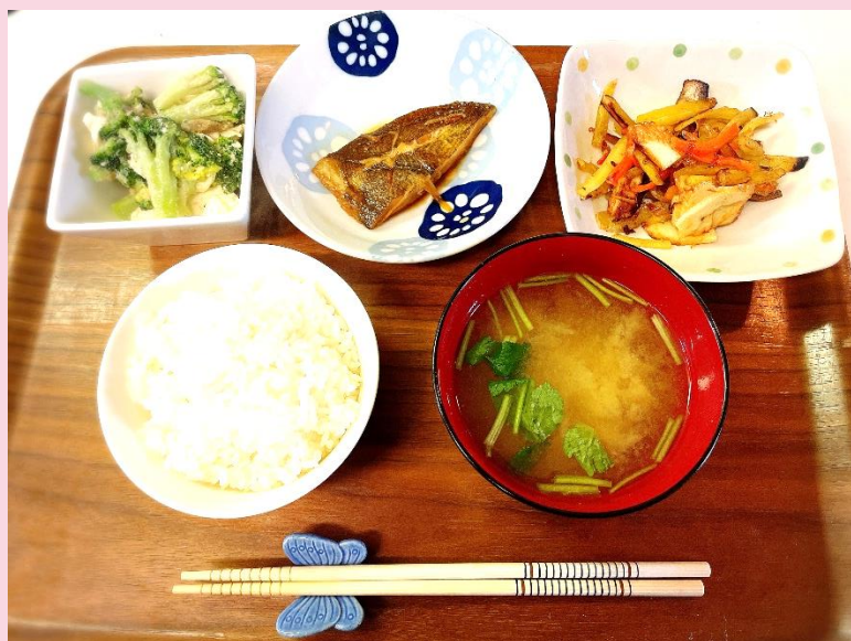
カレーの煮つけ定食