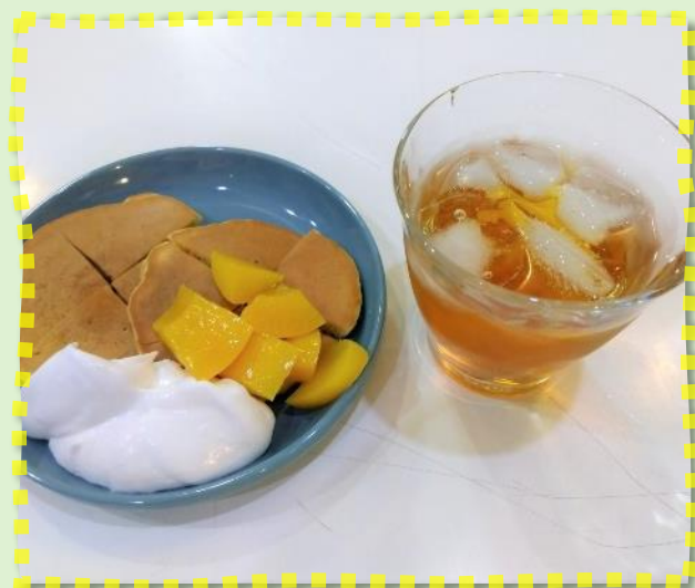
キャラメルナッツパンケーキ