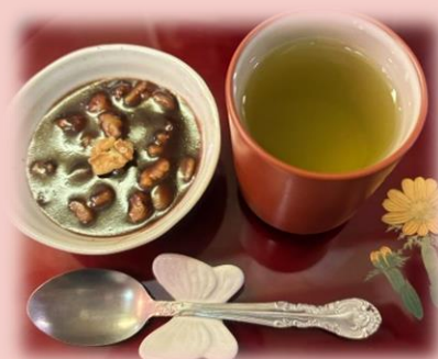
手作り黒糖胡桃羊羹