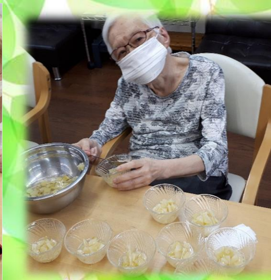
【三色丼】 皆様に盛り付けて いただきました